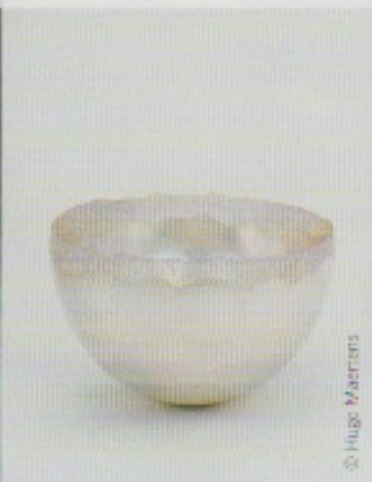
Hole Bowl IV.