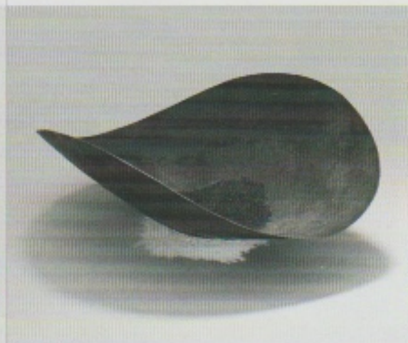
Hole Bowl I.