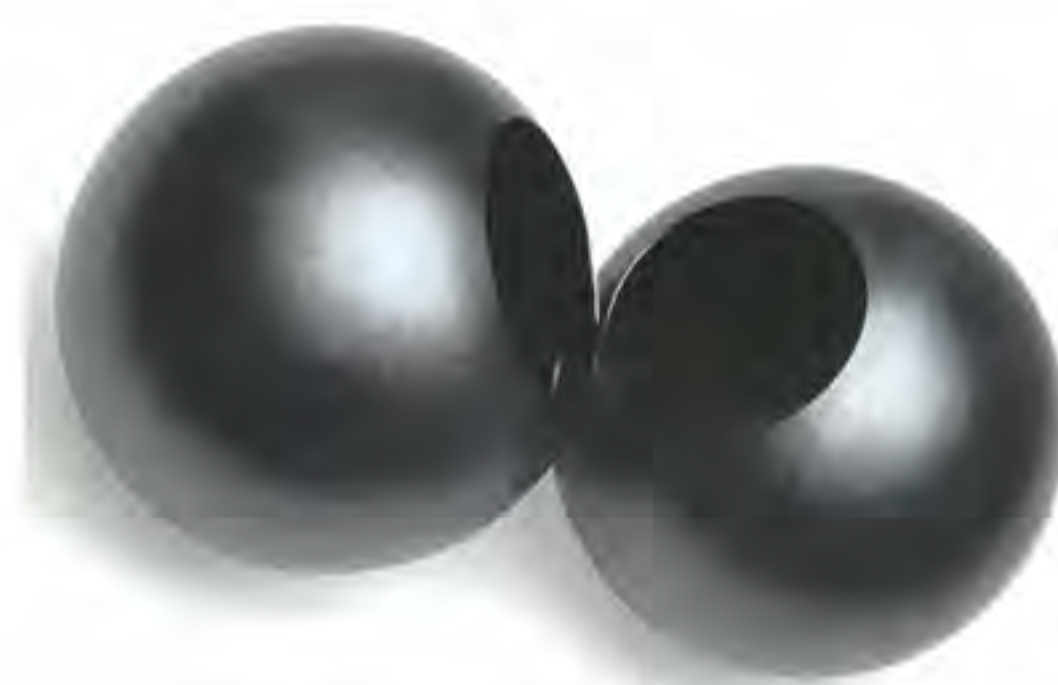
David Huycke: „Kissing bowls“, 2006. Silber